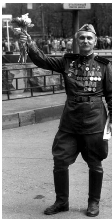
Мы придем, дедушка...