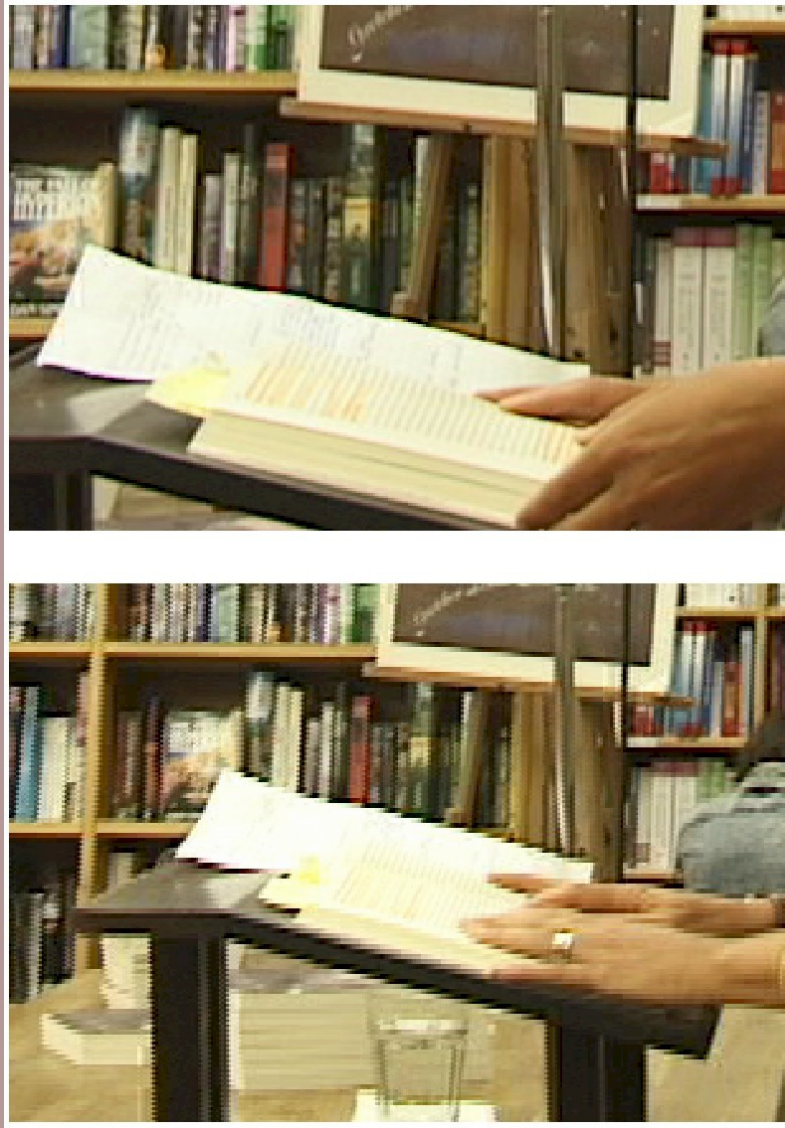
Figura 2. 200 x 300 pixel, trozo de una captura que muestra "luma undershoot (arriba)" y "escalones" (abajo) tomada con una Sony DCR-VX1000 durante un zoom y con autofocus apagado.

Este "dramatico" efecto aparece ocasionalmente, con imágenes bien iluminadas y de alto contraste, en tomas con un ángulo de unos 15 grado con la horizontal. Movimientos relativos, como un zoom, incrementa la posibilidad de ocurrencia. Otros intentos de repetir el fenómeno no han tenido éxito. Suelen ser defectos de implementación del CODEC, no del sistema en sí mismo.