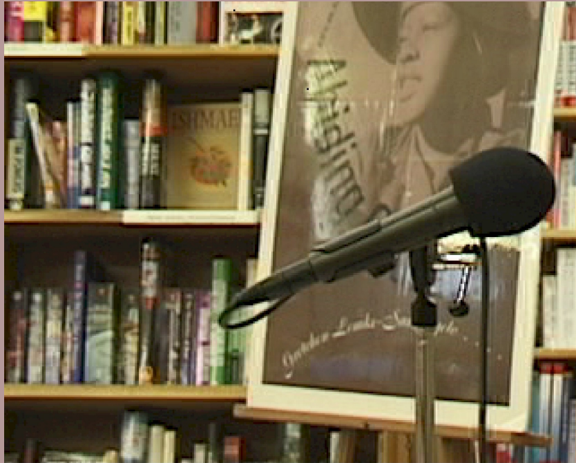
Figura 3. 320 x 260-píxel trozo de una captura con la CR-VX1000 mostrando detalles de alta frecuencia en un libro y un poster.