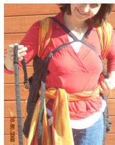
Falls sie der Hüftgurt stört, nehmen sie ihn einfach ab