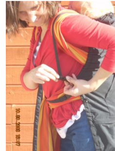
Weitere Möglichkeit: Wie ein Rucksack über die Schultern bringen und schließen