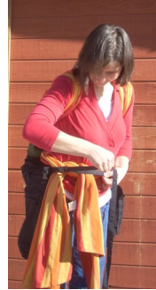
Gewünschte Länge einstellen