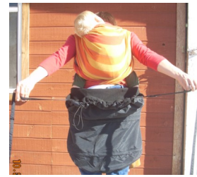
Beide Gurte mit den Händen nach oben bringen