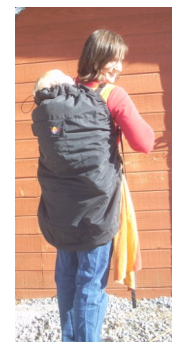
Geschützt, warm, und sicher ist ihr Baby bei ihnen eingekuschelt