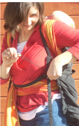
Den Gummizug um die Beine ihres Kindes einstellen