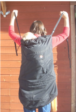
Bis zum Hals ihres Kindes hochziehen