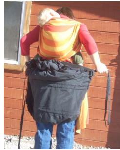
Auf den Rücken, unter dem Baby legen