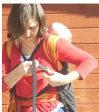
Weitere Möglichkeit: Einen Knoten ueber der Brust und dann schließen