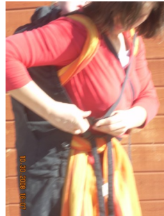
Anderen Gurt auch schließen