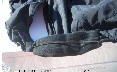
Kletterverschluss öffnen, um Gummizug legen und schließen.