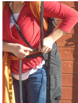
Über die Schultern bringen und schließen