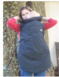
Über die Schultern legen