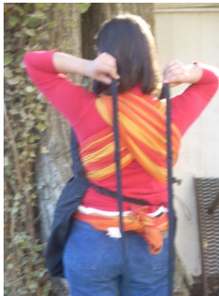
Schauen dass die Bahnen gerade liegen