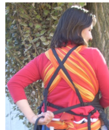
Gewünschte Länge einstellen