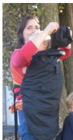
Kapuze aus dem Kragen nehmen