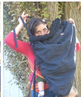
Über den Kopf heben