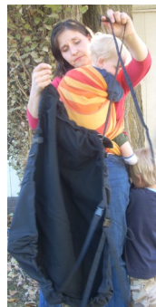
Den obersten Gurt aufmachen und auf der anderen Schulterseite schließen