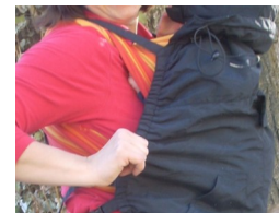
Der Gummizug vor der Brust schmiegt sich sacht an ihren Körper an