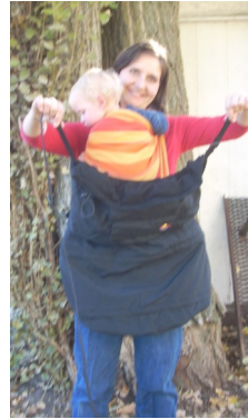
Obere Strippen über Baby heben