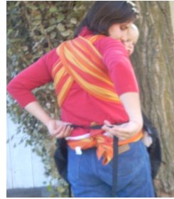
Gewünschte Länge einstellen