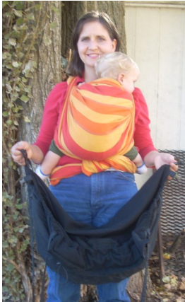
Bei den untersten Schnallen vor dem Bauch halten