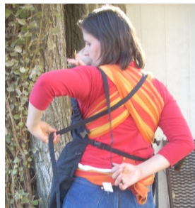
Auf dem Rücken kreuzen und beide Seiten schließen